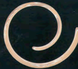
Барбара Статман Род. в 1945, Монреаль Кольцо Это девочка! (2) 1998 Золото, серебро, магнитная проволока 6,5 x 3 x 2 см Коллекция Лилианы и Дэвида Стюартов